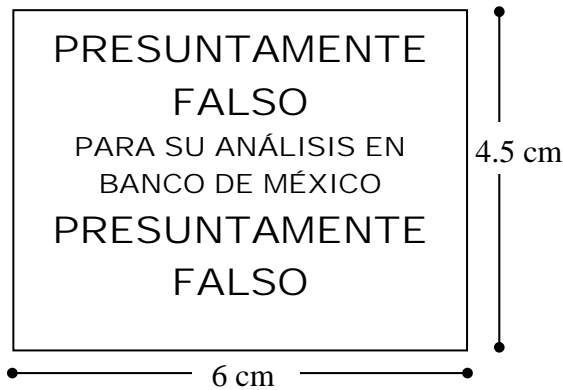
Modelo "A" – Sellos sin logotipo